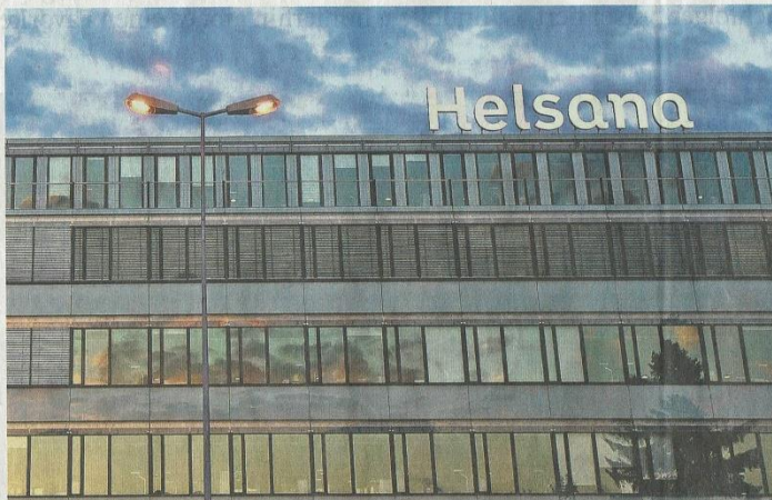
Bei der Helsana sind Verwaltungskosten seit Jahren hoch: Firmensitz in Dübendorf ZH.

Doch die Unterschiede bei der Effizienz der Verwaltung sind riesig: Setzt man die Verwaltungskosten in Bezug zu den Prämien-